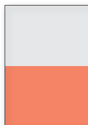
1/2 Seite quer 210 x 145 mm